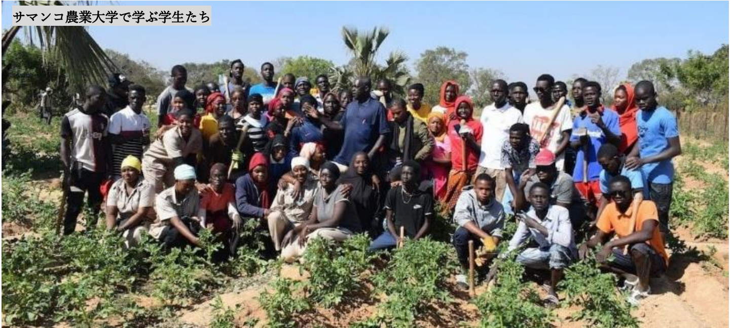
サマンコ農業大学で学ぶ学生たち

学生たちは、灌漑設備の整備された圃場で、実際に土に触れながら、農業の技術を学習することができます。また、同センターでは、JICAのSHEP（市場志向型農業振興）アプローチを含む市場志向型農業のアプローチを採用していますが、これは農家の起業家精神を高め、貧困の連鎖を断ち切り、コミュニティレベルで家庭の栄養状態を改善することを目的としています。